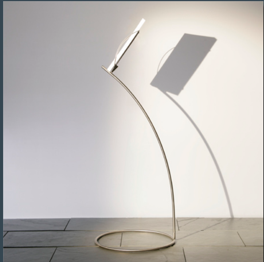
Standsicher und bei Bedarf transportabel: EVA